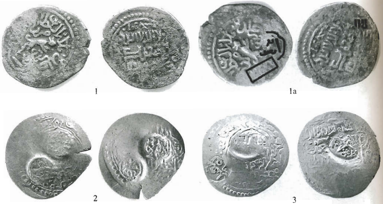
1 — Медный фельс Барда; 2 — Серебряный дирхам с надчеканами ابو سعيد Абу Са'ид и всадник с соколом; 3 — Серебряный дирхам с надчеканками ابو سعيد Абу Са'ид и بهسنا Бехесна — город в Анатолии (Ölçer, 1987, P. 19-22).

Ныямаа Badarch. Description of Mongol scripts on the Ilkhanid Golden Coins